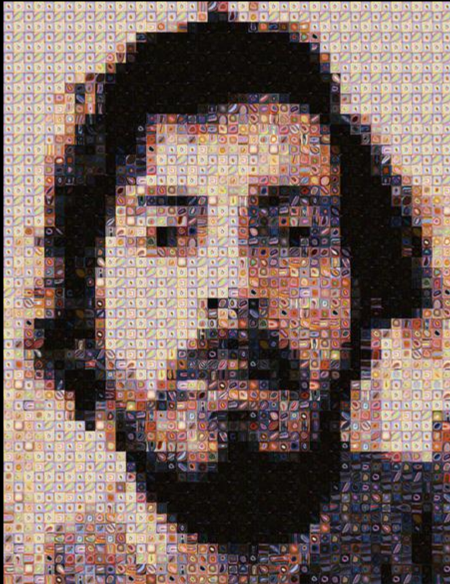
Chuck Close: Gerasterte und fragmentierte Auflösung der Fläche in ihre Einzelteile